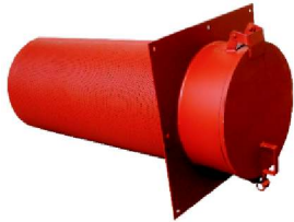
Aeroduto Circular Horizontal