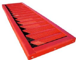
Cobertura de Canal Ondulada