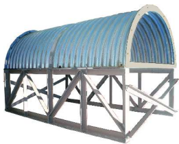
Aeroduto MCH (meia cana altura)