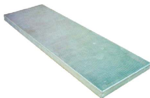
Cobertura de Canal Plana